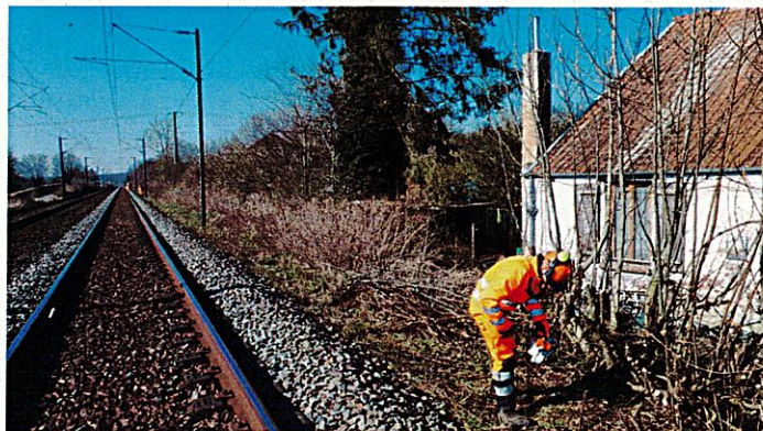
Illustration d'une intervention de maîtrise de la végétation, dans les Hauts-de-France, 2022

Conscient de la gêne occasionnée, SNCF Réseau vous remercie de votre compréhension en cette période de travaux.